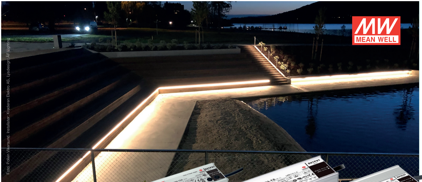
Installatør: Krøderen Elektro AS, Lysdesign: AF Lighting